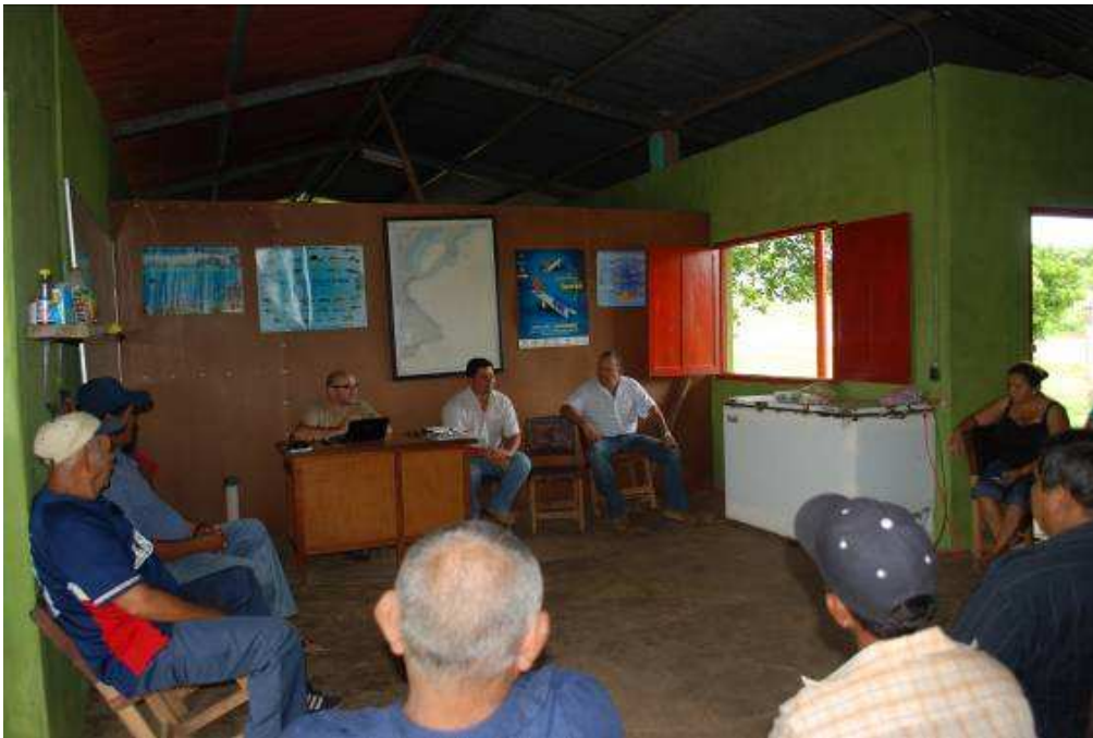
Foto 2: Reunión con Formadores y Pescadores en la comunidad Enea (Panamá)