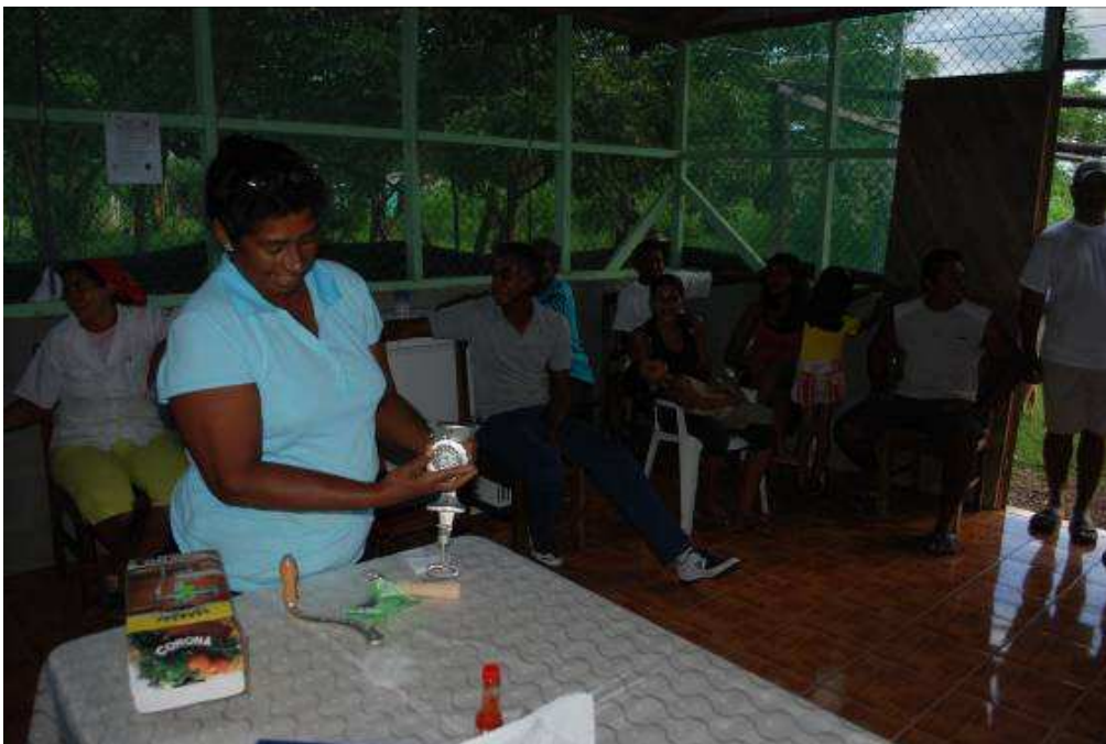
Foto 3: Reunión con la comunidad de pescadores de la Isla de Chira (Costa Rica)