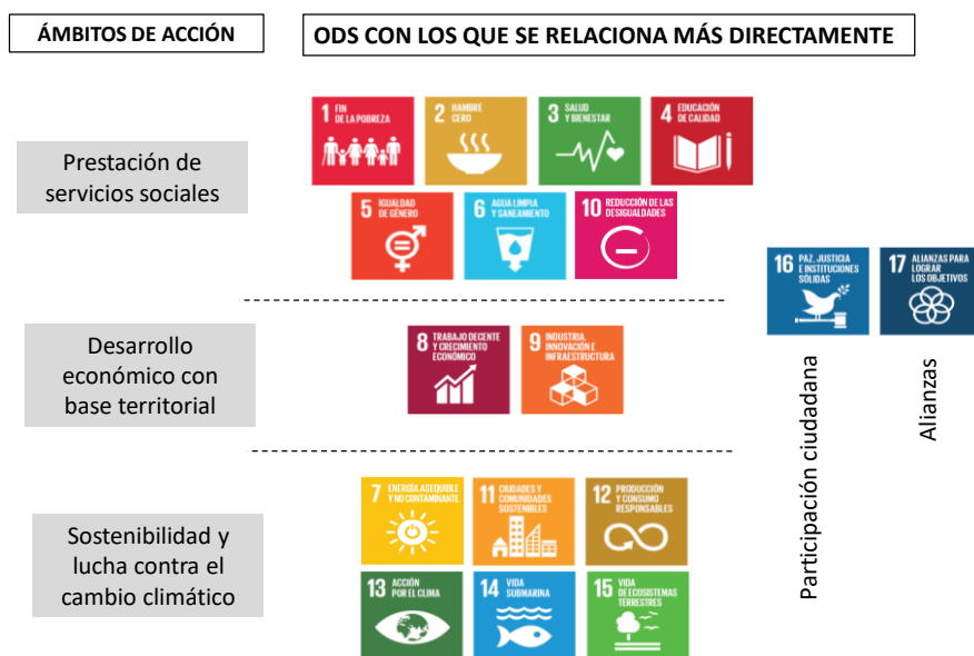
Figura 3: Os gobernos sub-estatais ante a axenda dos ODS