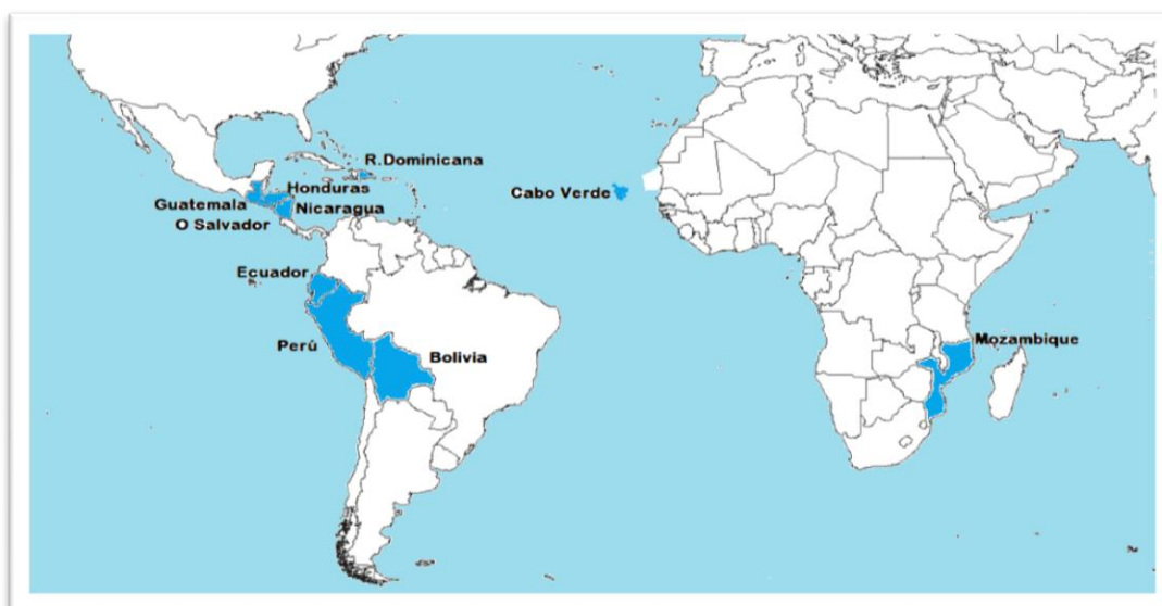
Mapa 1: Países prioritarios candidatos da Cooperación Galega, 2018-2021

América Central: Guatemala, Honduras, Nicaragua e O Salvador.