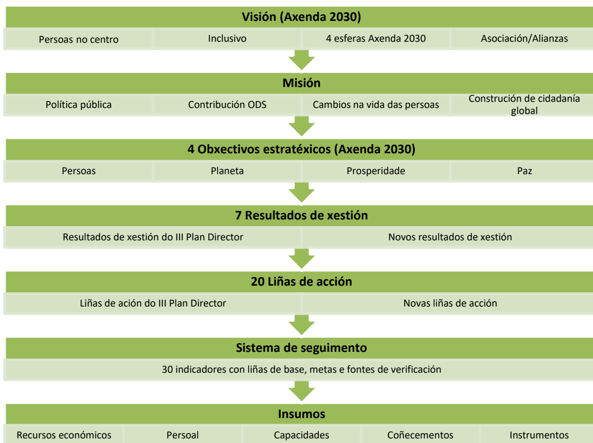
Figura 2: Esquema da planificación estratéxica do IV Plan Director da Cooperación Galega

Tal e como describe a figura anterior, o IV Plan Director debe dar continuidade ao marco estratéxico simplificado e operativo do III Plan Director baseado no criterio proposto polo modelo de xestión orientada a resultados de promover unha maior simplicidade mediante un maior alcance na formulación dos resultados, liñas de acción e indicadores.